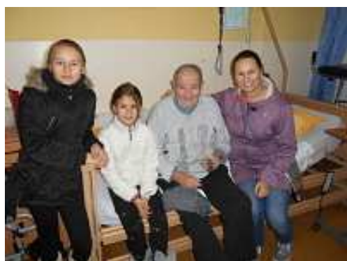
Foto z uskutečněných setkání a předávání dárků:

Jak bylo zmíněno již v úvodu, Český rozhlas v letošním roce spustil předvánoční charitativní akci s názvem Ježíškova vnučata. V rámci tohoto projektu, do kterého se zapojilo více než 500 domovů, se seniorům plní jejich malá či velká přání. Příspěvková organizace Sociální služby Semily se zapojila do tohoto projektu více než dvěma desítkami přání osamělých uživatelů služeb Domova pro seniory a Domova se zvláštním režimem.